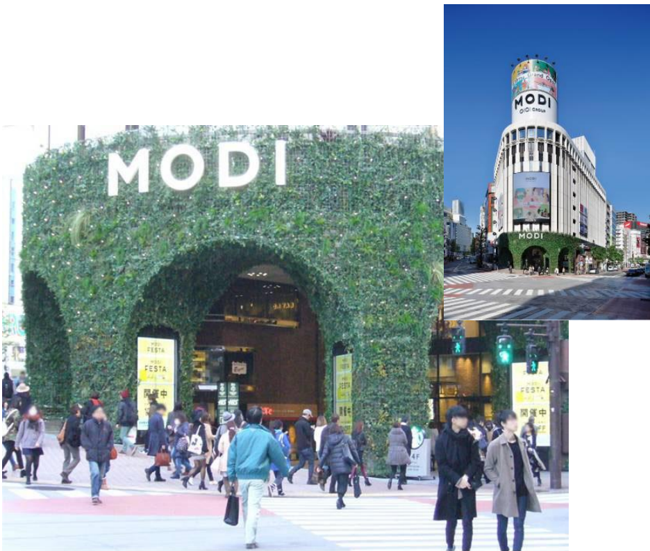
※画像はすべてイメージです

公園通り・神南・代々木エリアの入り口に位置し、歩行者からの注目率は抜群の媒体です。渋谷エリアの露出を高めるメディアとして注目を集めています。お申し込みは、専用サイトからできます。